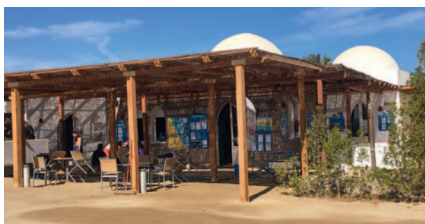
Die deutschsprachige Tauchbasis im Hotel: TGI Diving.