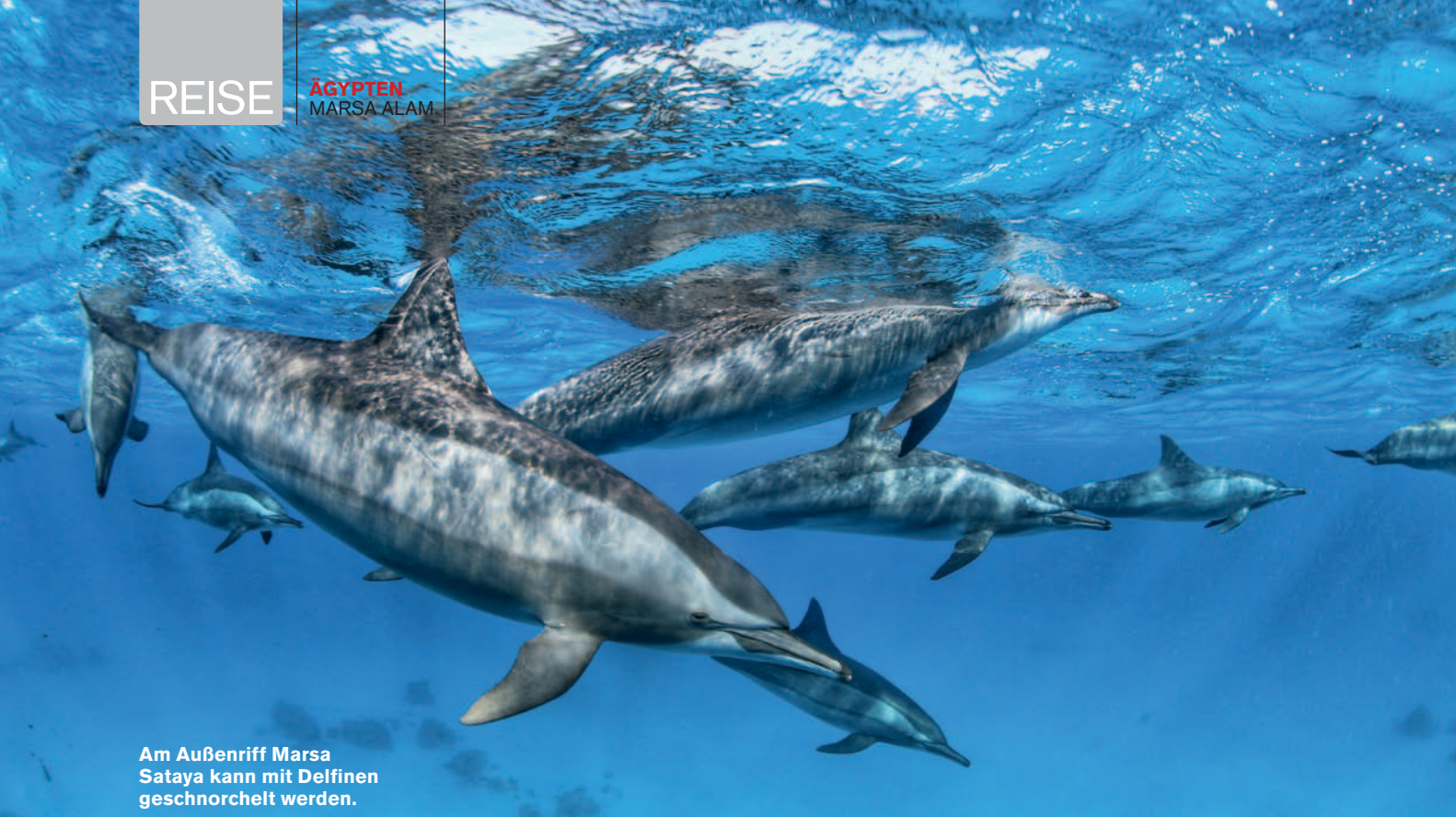
Am Außenriff Marsa Sataya kann mit Delfinen geschnorchelt werden.

der Wilderer weigert sich, in das Boot zu steigen. Er flüchtet an den Strand, wo ihn nicht nur die Ranger des Nationalparks, sondern auch eine empfindliche Geldstrafe erwarten.