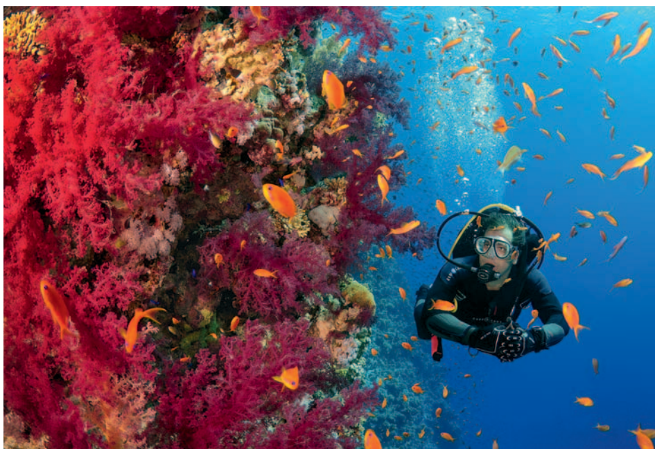
Gesunde Riffe: Die Korallen im Wadi-el-Gemal-Nationalpark sind traumhaft farbenfroh.

Ein weiterer Spot, der bekannt ist für seine Großfischbegegnungen, ist Elphinstone. Obwohl nicht im Nationalpark gelegen, lässt er sich per Bus für einen Tagestauchtrip erreichen. Denn wer eine Begegnung mit Weißspitzen-Hochseehaien, besser bekannt als Longimanus, auf der Wunschliste stehen hat, rechnet sich dort die besten Chancen aus. An der Nordspitze des Riffs wird abgetaucht. Die starke Strömung und die Tiefe des Plateaus machen es anspruchsvoll dort zu verweilen. Deshalb tauchen wir etwas flacher, um uns im Anschluss an der östlichen