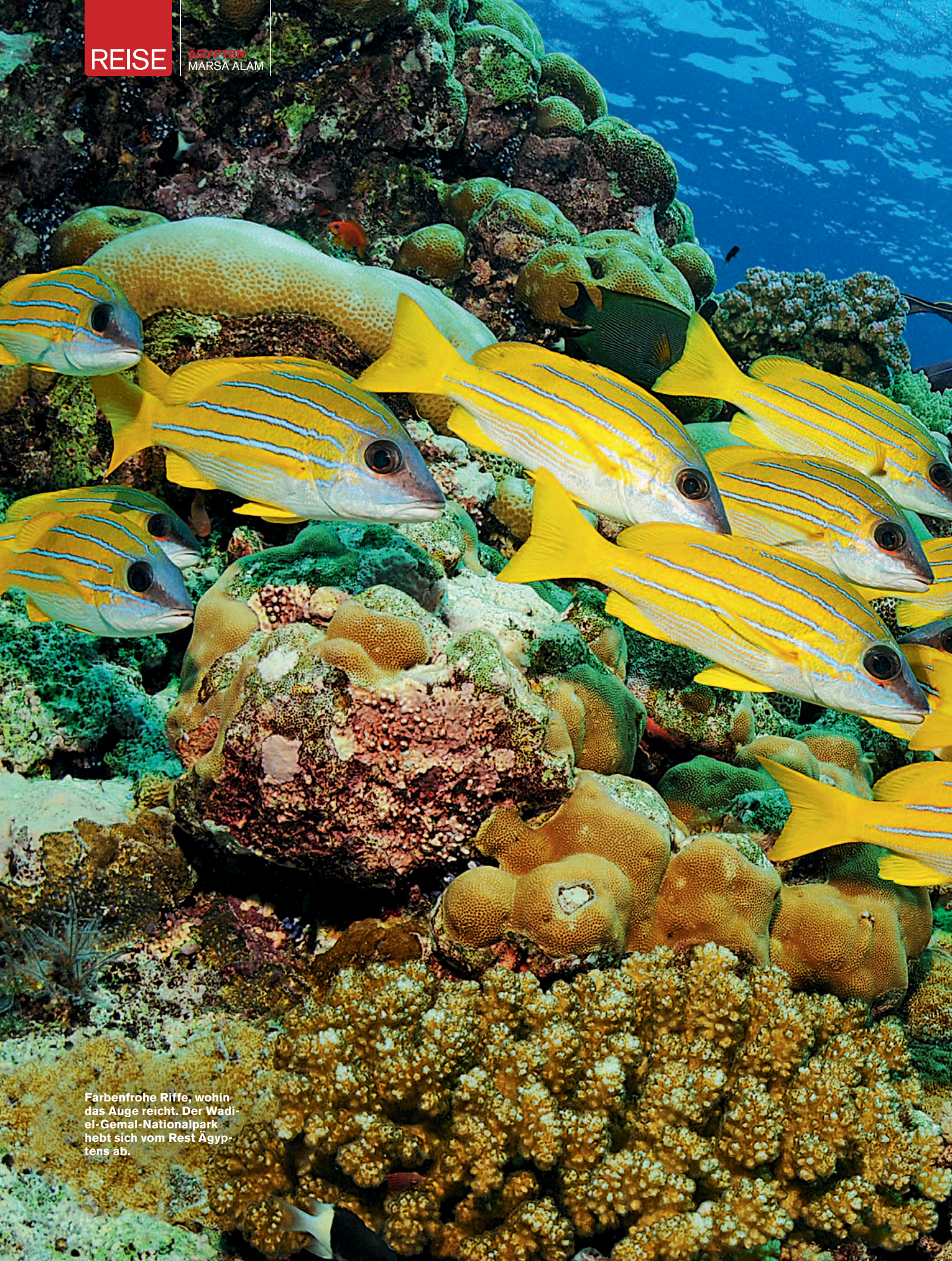
Farbenfrohe Riffe, wohin das Auge reicht. Der Wadi-el-Gemal-Nationalpark hebt sich vom Rest Ägyptens ab.