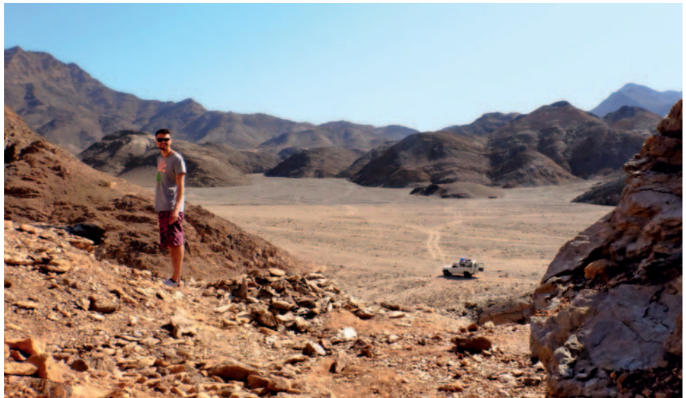
In den Wüstentälern Wadi el Gemals gibt es Höhlen, römische Tempel und Ruinen, Oasen sowie Beduinen-Camps zu entdecken.