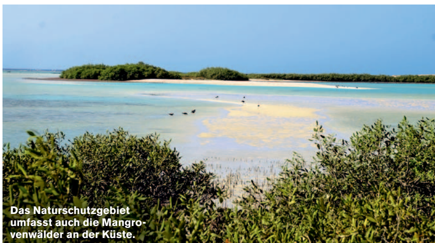
Das Naturschutzgebiet umfasst auch die Mangrovenwälder an der Küste.