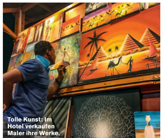
Tolle Kunst: Im Hotel verkaufen Maler ihre Werke.