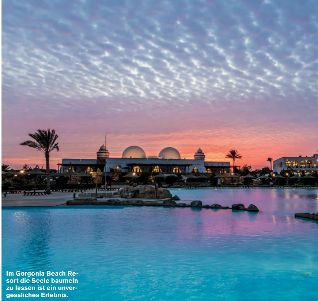
Im Gorgonia Beach Resort die Seele baumeln zu lassen ist ein unvergessliches Erlebnis.

Gemeinsam erkunden wir das Wrack des maltesischen Massengutfrachters „Hameda“. Ein Schiff das vor 23 Jahren mit einer großen Ladung Plastikgranulat verunglückt ist. Wenn man genau hinschaut, finden sich auch heute noch Teile der Ladung am Strand von Abu Ghosun. Schöner als der Ausblick auf Plastik im Sand ist jedoch das Wrack selbst. Es ist in zwei Teile zerbrochen